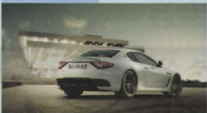
Maserati GranTurismo MC Stradale