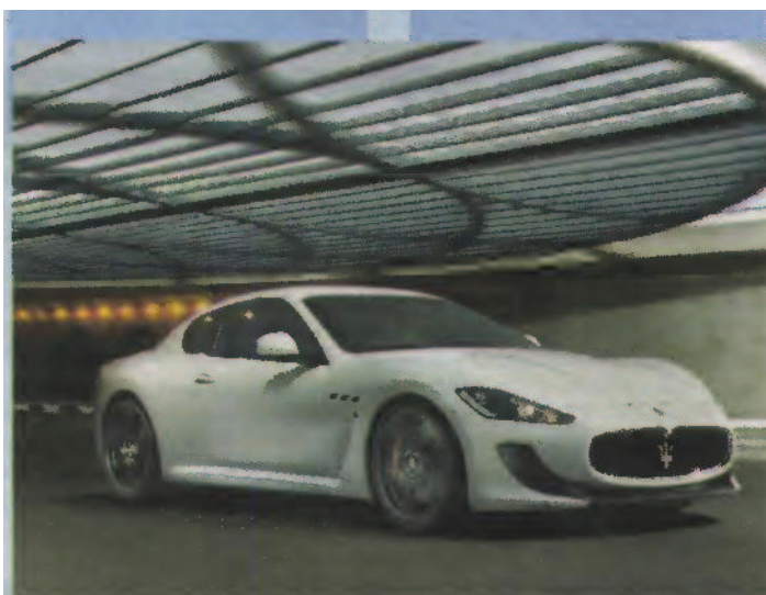
Skoda Fabia « Monté Carlo »