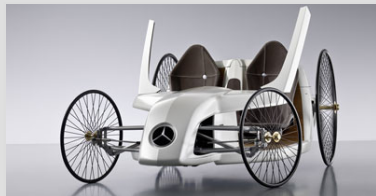
Mercedes F-CELL Roadster : hybride rétro-moderne